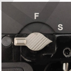
Pozice SAFE "S"

V pozici FIRE "F" je zbraň odjištěna a připravena ke střelbě.