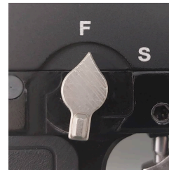
Pozice FIRE "F"