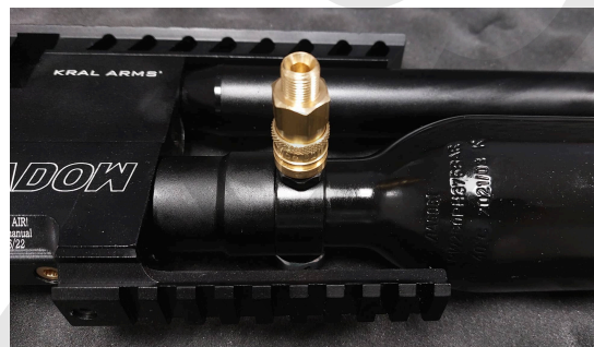
Rychlospojka nacvaknutá na plnicím pinu