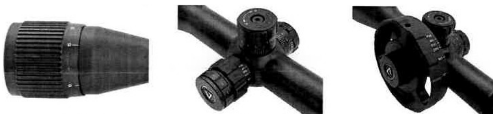
Paralaxa na objektivu / Paralaxa na domku ve středu puškohledu / kolo paralaxy

PARALAXA: Paralaxa slouží ke změně ohniskové vzdálenosti, která vede ke změně ostroty pozadí a kříže vzhledem ke vzdálenosti cíle. Paralaxa může být podle typu puškohledu umístěna na objektivu nebo na tzv. domku ve středu puškohledu. V případě paralaxy na straně je většinou puškohled vybaven kolem paralaxy pro její snazší ovládání.