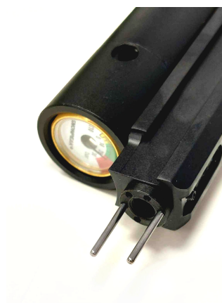
Obrázek č. 3.

Odšroubujte celou koncovku hlavně (viz obrázek č. 2)