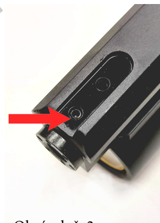
Obrázek č. 2.

Povolte zajišťovací červík pro uvolnění koncovky hlavně (viz obrázek č. 2).