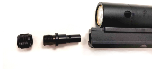
Obrázek č. 4.

Vyndejte koncovku hlavně a našroubujte adaptér pro moderátor v pořadí, které vidíte na obrázku č. 4. a 5.